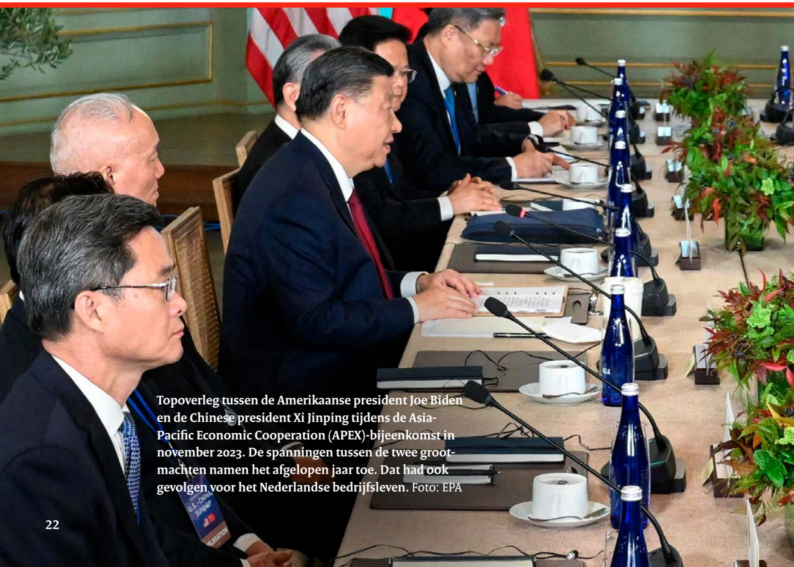
Topoverleg tussen de Amerikaanse president Joe Biden en de Chinese president Xi Jinping tijdens de Asia-Pacific Economic Cooperation (APEC)-bijeenkomst in november 2023. De spanningen tussen de twee grootmachten namen het afgelopen jaar toe. Dat had ook gevolgen voor het Nederlandse bedrijfsleven.