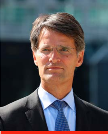
Erik Akerboom Directeur-generaal Algemene Inlichtingen- en Veiligheidsdienst

De veiligheid van Nederland is sterk verbonden met de veiligheid in de wereld. In de recente geschiedenis bleek dat zelden zo duidelijk als in 2023. Sprekend daarvoor zijn twee data.